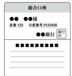
【通帳の見開きページ (イメージ)】