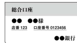
【通帳の表紙 (イメージ)】