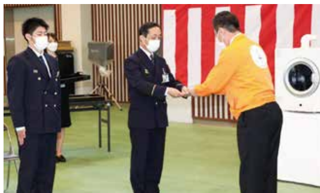
①中野青年部会長が目録を大下消防学校長に贈呈