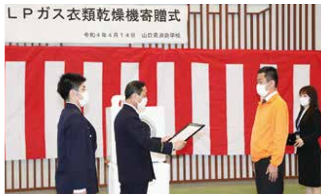
②消防学校長が感謝状を青年部会長に贈呈