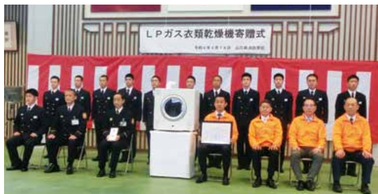
④寄贈式出席者による集合写真